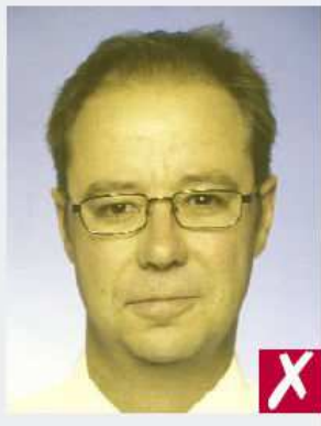
Tez poco natural