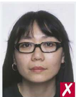
Marcos muy gruesos

La foto debe dejar ver con claridad sus ojos (sin vidrios demasiado ahumados, ni con reflejos).