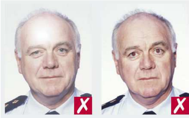
Reflejo del flash sobre la piel

Presentar un iluminación uniforme, sin provocar marcas de flash, ni ojos enrojecidos, ni sombra.