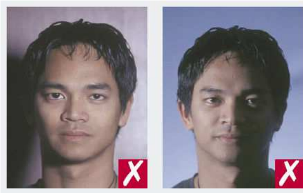
Sombras sobre el fondo