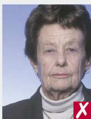
Foto mal centrada