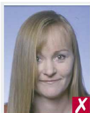
Cabello sobre el rostro