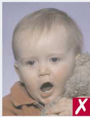
Boca abierta y presencia de un juguete