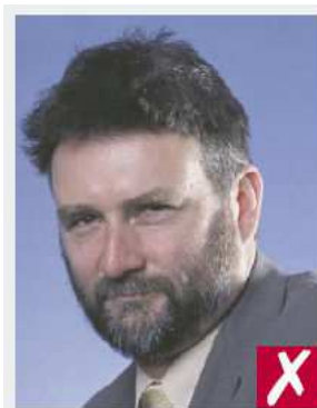
Fotoestilo « retrato »

Mostrar los ojos abiertos y claramente visibles.