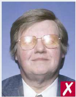
Reflejos sobre los vidrios